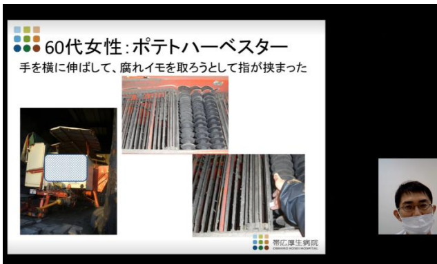
「仕事中の事故から命を守る」

農作業安全では、参加者から「ハーベスターの事故は特に注意しなければならないと感じた」や「事故には十分注意し作業したい」、また、タイプ別コミュニケーション法では「気が付かなかった自分の性格を知ることができた」や「パートさんに接する際に実践したい」など、さまざまな声が挙げられました。