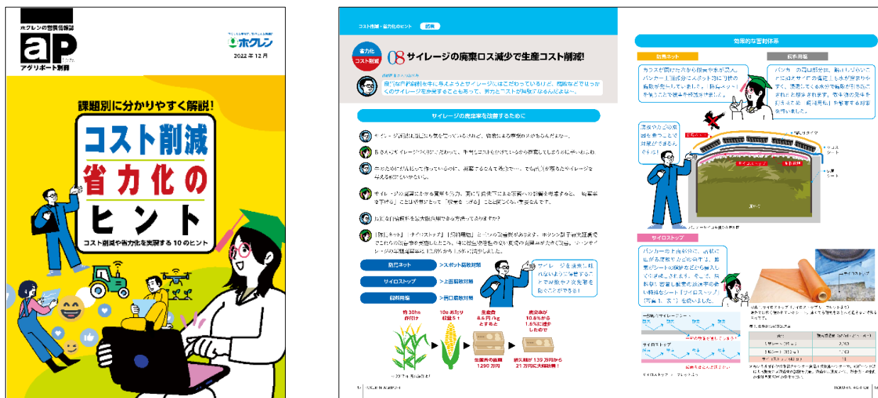
「コスト削減・省力化のヒント」表紙と誌面例

今後、この冊子は、2023年2月発刊のアグリポートVOL.41とともに各JA等に配付すると合わせて、「アグリポートWeb」でも記事形式で読めるようになります。ぜひご覧ください。