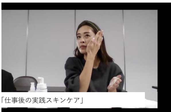
「仕事後の実践スキンケア」