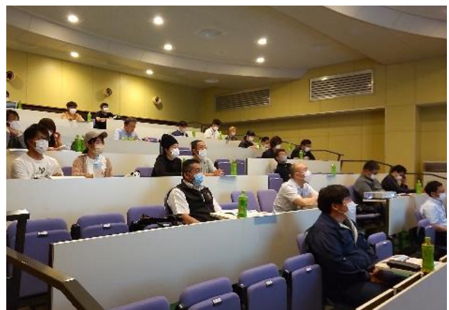
講演に聞き入る生産者、JA関係者