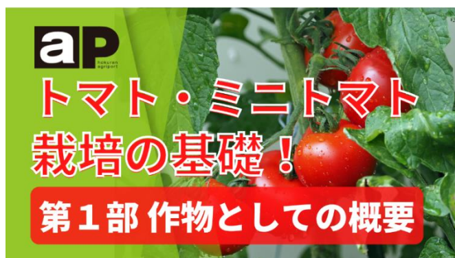
トマト・ミニトマト栽培の基礎 動画再生リスト2次元コード