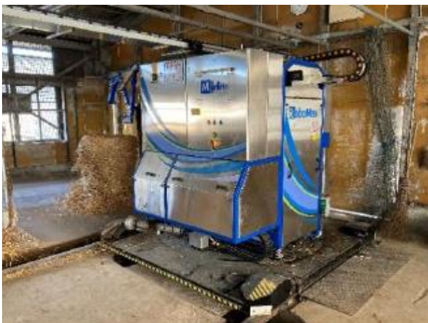
搾乳ロボット外観

ホクレン訓子府実証農場では、タイストール牛舎における労働負荷軽減などの課題解決に向け、タイストール用搾乳ロボット（Milkomax 社 RoboMax、代理店(株)ピュアライン）を昨年 12 月に導入しました。1 月より搾乳を開始し、導入直後は凍結対策や操作方法の習熟といった課題がありましたが、3 月には自動運転で 11 頭の搾乳を行っております。今後、タイストール用搾乳ロボットの導入を検討されている方々の視察、研修の受け入れをしていきますので、ご興味のある方は、支所営農支援室までご連絡ください。