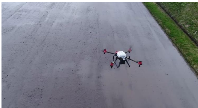
ドローンを使用した播種の様子（令和3年5月撮影）

深川市内と北竜町内の2カ所で実施した試験の結果、点播機で播種した隣接圃場と生育や収量・品質はほぼ同等という結果でした。一方で、ドローンによる播種ではムラが生じるなどいくつかの問題も分かったことから、今年度も引き続き試験に取り組みます。