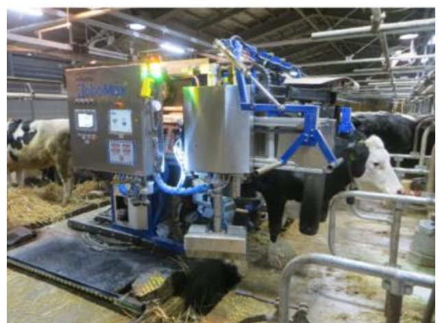
ロボットでの搾乳