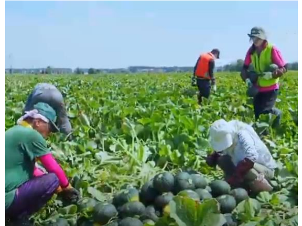
かぼちゃ収穫の様子（アグリポートチャンネルより）