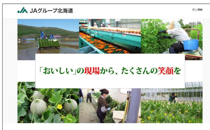
JA グループ北海道 求人サイト トップページ

今回制作した農業求人サイトは、「アルキタ」や「しゅふきた」などの地域密着型求人サイトや大手求人検索サービスなど複数媒体に同時掲載することで露出度をアップし、求人広告