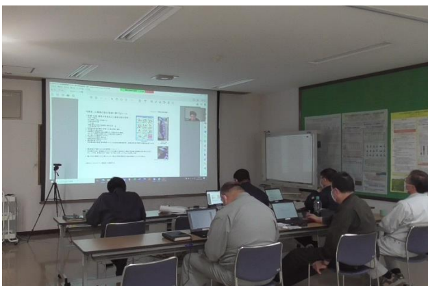
帳票類の確認を会議室で Zoom で実施

ガイドラインの各要件を満たしていることを、あらかじめ確認後、審査会社へ申し込み、事前の接続テスト（今回は Zoom を使用）を経て、審査当日は、審査員の指示に従い、必要な帳票や圃場環境などを写真や動画で示し、通常は現地、対面で行う審査を、遠隔で無事に終わることができました。