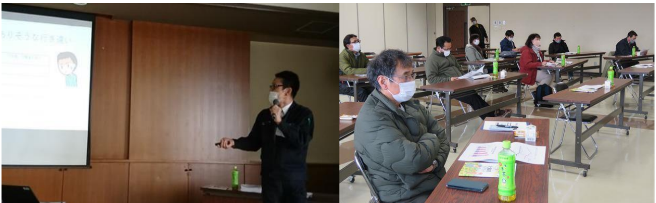
中標津支所営農支援室から従業員の定着促進に向けたポイントを説明

講習会では、第一次産業ネットを運営する株式会社 LifeLab から、求職の応募数増加への効果的な Web 求人広告掲載方法の紹介がありました。また、ホクレン中標津支所営農支援室から従業員の定着促進に向けたポイントなどを説明しました。今後も求職者の応募増加と定着促進の一助となる取り組みを継続していきます。