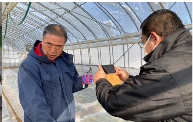
栽培環境をスマホで Zoom を用いて報告