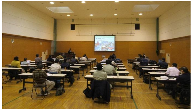
1月19日試験成績発表会の様子

後志管内の技術的課題解決を効率的に進めるために、各関係機関の取組成果情報を共有することで、参加者の資質向上も図れました。