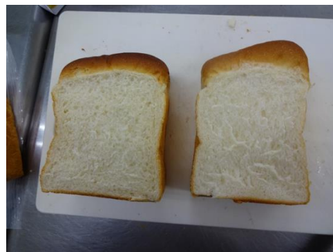
左：中標津産「春よ恋」 右：市販「春よ恋」 で試作したパン