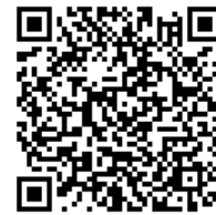
「子牛飼養管理のクエスチョン」動画2次元コード