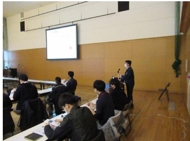
「後志管内スマート農業推進会議」の様子