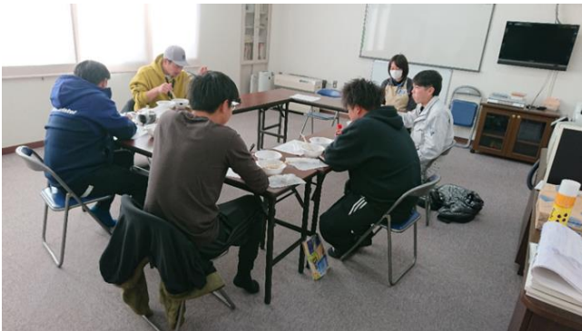
小麦生産者と食味試験の様子

12月28日には、中標津産小麦粉と市販小麦粉をそれぞれ使用したパンとうどんを作り、生産者、JA、普及センター、支所営農支援室で食味試験を行いました。試験ではどちらが中標津産かわからない状態で行いましたが、参加者が食味の感想を活発に議論しながら書いたアンケートの結果はパン、うどんともに市販小麦粉と比べてそん色ないものになりました。