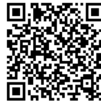
「パワールーブ3」動画2次元コード