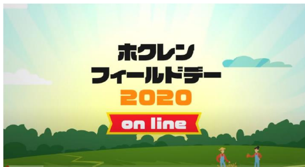
ホクレンフィールドデー2020 動画

URL ( https://hokuren-news.jp/ ) 入力か WEB 検索により「ホクレンインフォメーション」にアクセスし、「記事カテゴリー」から「農業総合研究所」を選び、「ホクレンフィールドデー2020」から動画をご覧ください。