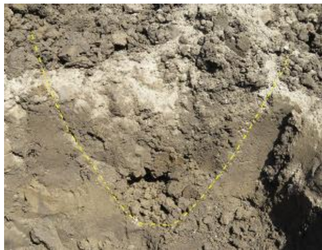
施工後の土壌断面 (黄色線の内側が施工された場所～小さな土塊が多い)