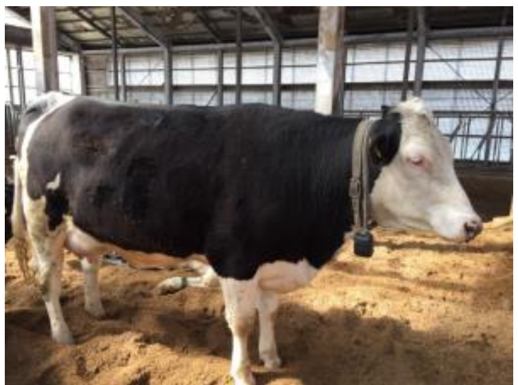
ホルスタイン種とモンベリアード種の交配種 (2018年5月出生)