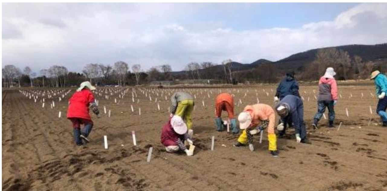
春播き小麦の播種作業の様子