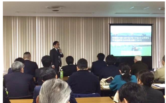
昨年の交流会の様子

「ホクレン農業総合研究所情報交流会」は、生産者や農協職員に向けて、農業総合研究所で得られた研究成果から、現場での即戦力が期待される結果を中心にご紹介するイベントです。ぜひご参加ください。