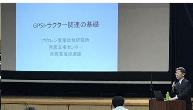
「研修会のポイント」を説明する苫小牧支所荘司室長