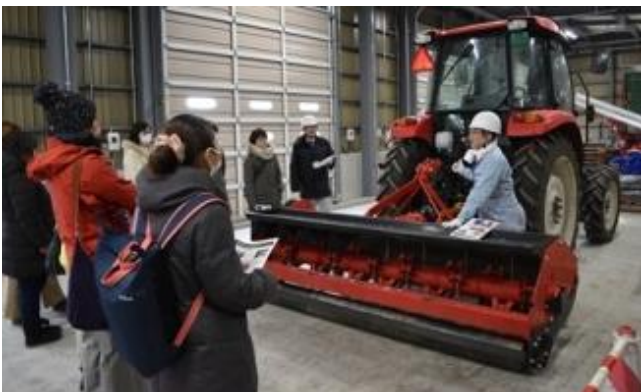
機械を見ながら危険な箇所や作業内容を確認