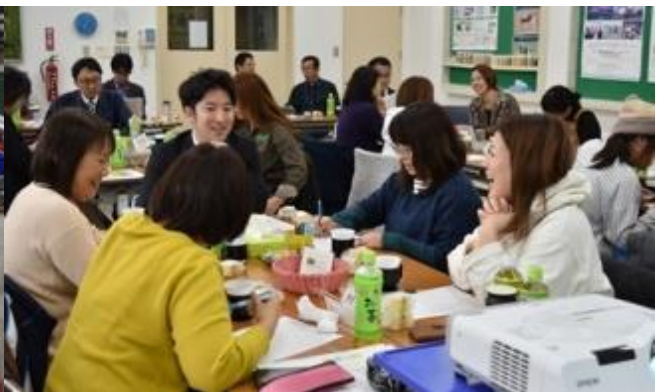
お茶とお菓子を食べながら意見交換