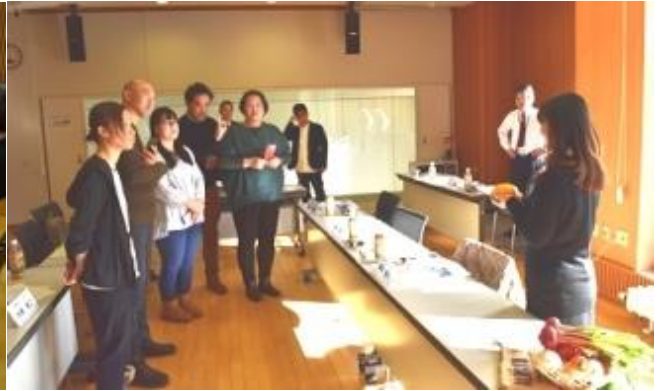
編集部とアグリポーターで写真撮影のミニ講座