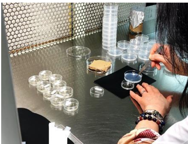
小麦の花粉が詰まっている「 やく 薬」を培養

現在、春播き小麦（パン用）の主力品種となっている「春よ恋」は、当農場で やく 薬培養により育成・開発した品種です。「春よ恋」に続く優良な品種を効率的に開発すべく、日々研究に取り組んでいます。