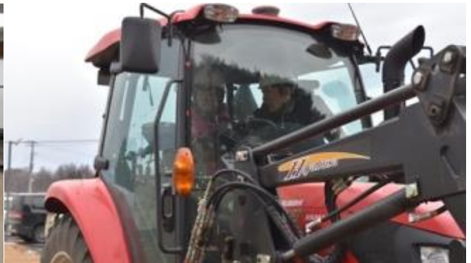
自動操舵トラクターの試乗