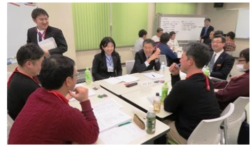
昨年の研修会の様子

ホクレンでは、担い手生産者を対象に「水稲」をテーマとした研修会を下記のとおりで開催します。水稲に関する栽培の基本や販売情勢など、幅広く学ぶことができます。また、同じような立場の受講者同士のネットワークづくりの場としても有効です。ぜひご参加ください。