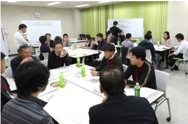
「トマト」の研修会での意見交換の様子

両研修会では、テーマとなった作物に関する基本的な栽培技術などについて学んだほか、受講者同士の意見交換や交流会を通じて、地域を越えたネットワークづくりが行われました。札幌会場の次回の担い手向け研修会は、2月19～20日に「水稻」をテーマとして実施予定です。