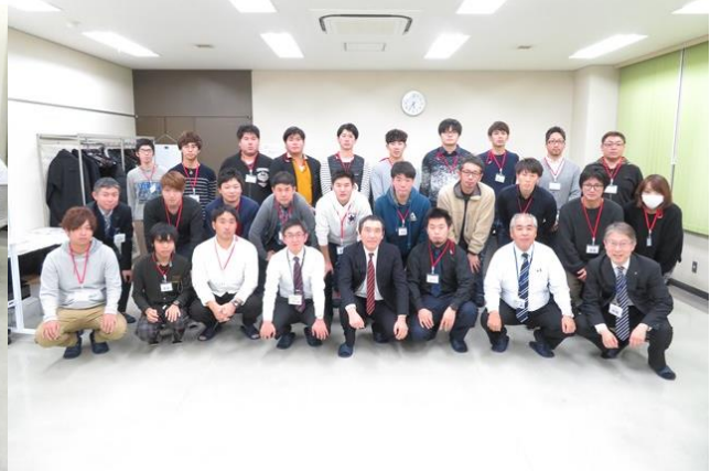
「小麦・大豆」の研修会の受講者