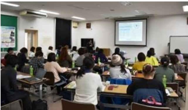
午前は座学で基礎知識を習得

研修会は、女性が参加しやすいように10～15時に実施。「農作業安全」「GAPでみる農場管理」「自動操舵トラクターとガイダンスの仕組み」について、午前は座学、午後は施設見学やトラクター操作の実技を行いました。また、研修会の最後に設けた「意見交換ティータイム」では、お茶とお菓子を食べながら4～5名の班ごとに意見交換を実施。女性同士の悩みなどについてお互いにアドバイスしました。