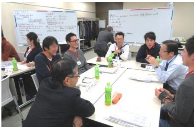
昨年の研修会の様子

ホクレンでは、担い手生産者を対象に「小麦・大豆」をテーマとした研修会を下記のとおりで開催します。昨年につき今回は2回目の開催となります。昨年の同研修会は28名が参加し「講習内容も良く、たくさんの人と交流できた」などのコメントがあり好評でした。今年も皆様のご参加をお待ちしています。