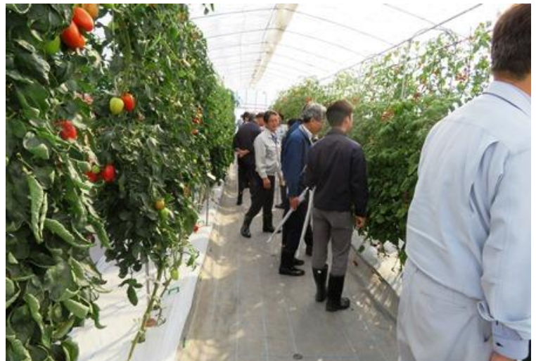
トマトハウスを見学