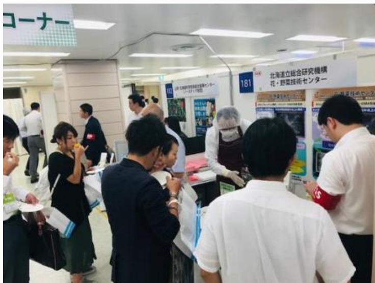
インフォメーションバザールでの MA フィルムで輸送したスイートコーンの試食の様子

また、11月20日に開催予定の道総研オープンフォーラム「たべ LABO マルシェ」では、当技術の詳細について、花・野菜技術センターとホクレン農総研の担当者が説明します。ぜひご来場下さい。