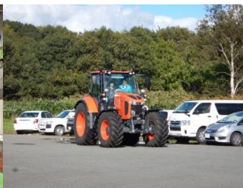
GPS自動操舵トラクター試乗会の様子