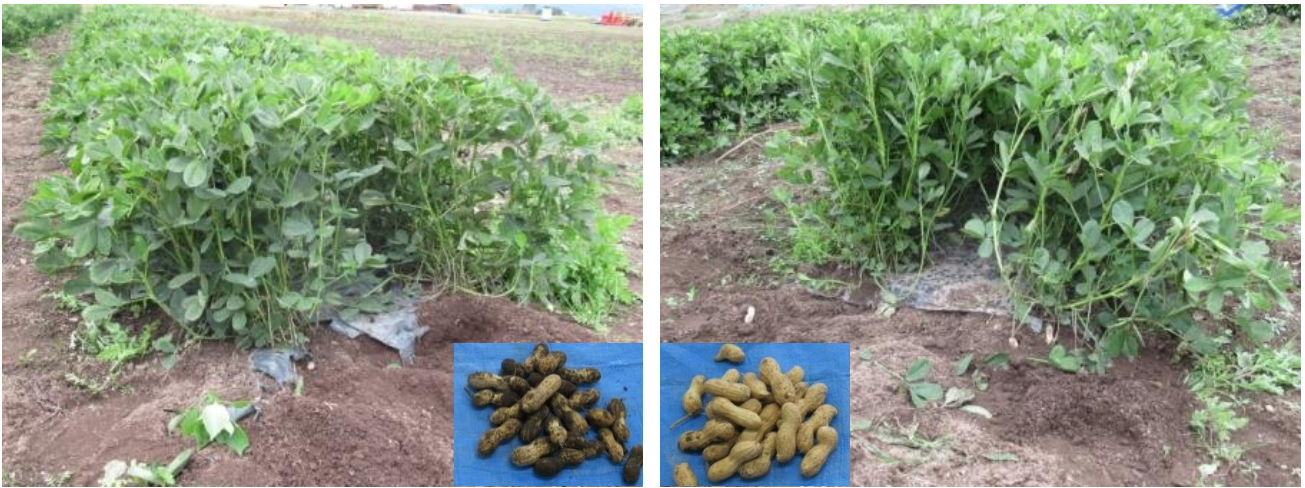
生分解性マルチで栽培した慣行区(左)と銀ねずポリマルチで栽培した試験区(右)

※子房柄…花が咲き終わった後に、花の付け根の子房が根のように土に向けて伸びた部位。土中でさらに伸びた子房柄の先端が膨らみ子実となる。