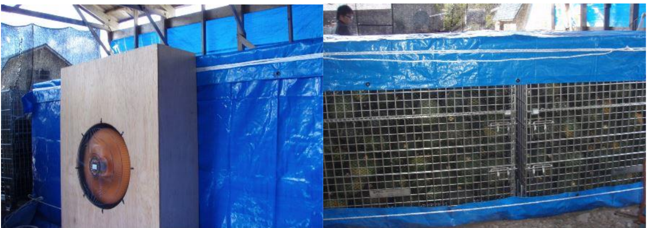
ファン（左）でコンテナ内の空気を吸引することで通気口（右）から効率的に空気を取り入れ通風させる

今後、腐敗果の発生状況などを確認し、低コストで省力化に結びつく新たな風乾技術としての可能性について検証していく予定です。