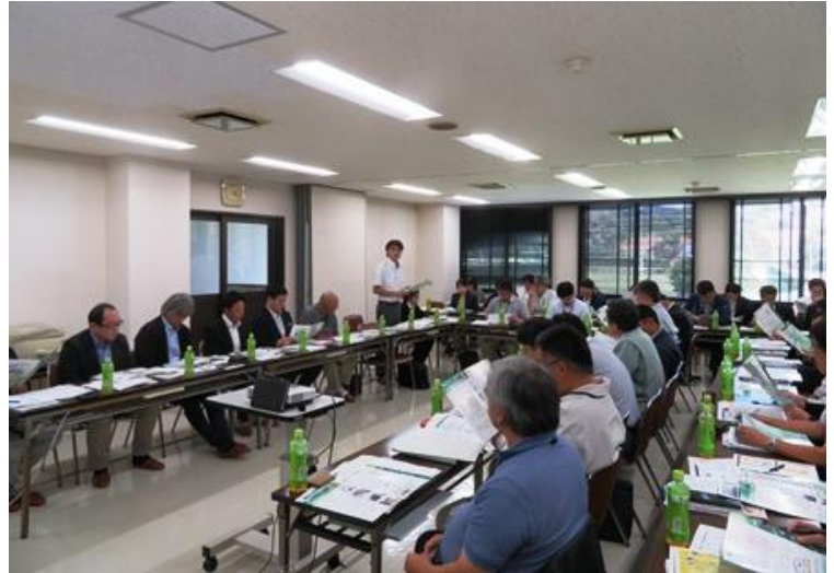
活発な議論が行われた意見交換

ホクレンでは今後も農福連携に向けた協議を継続し、まずは南空知エリアを中心に地域共生のモデルづくりを行い、他地区にも発展させたいと考えています。