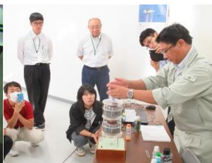
BB 肥料の配合についての説明