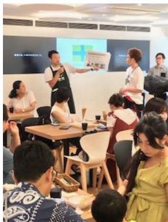
盛り上がった「酪農クイズ」

そのほか、バターをたっぷりかけたスイーツコーンや馬鈴しょの試食が好評で、首都圏の消費者へしっかりPRすることができました。