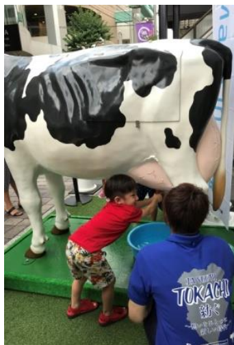
疑似搾乳体験は子どもに人気