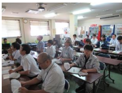
王子コンテナでの説明を聞く職員

王子コンテナでは、農産物段ボールに関する基礎知識や品質管理について説明を受けました。参加者からは消費税増税による出荷対応や災害に関する段ボール製品について質問があるなど、積極的に学ぶ様子が見られました。また、ホクレン肥料では製品工程やコスト低減に向けた取り組み、空知特有の土壌改善等について意見交換が行われました。