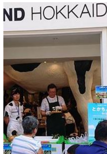
試食に「うまい！やばい！」