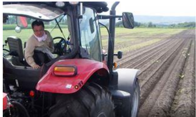
自動操舵使用区（運転者は後方のみを重点的に確認）

その結果、自動操舵を使用することで、トラクターの運転初心者でも作業時間が23%軽減できることが実証されました。詳細な試験結果は現在集約中ですが、今後、2カ年のデータ（1年目は習熟者による試験実施）を集約し、講習会などで情報発信する予定です。