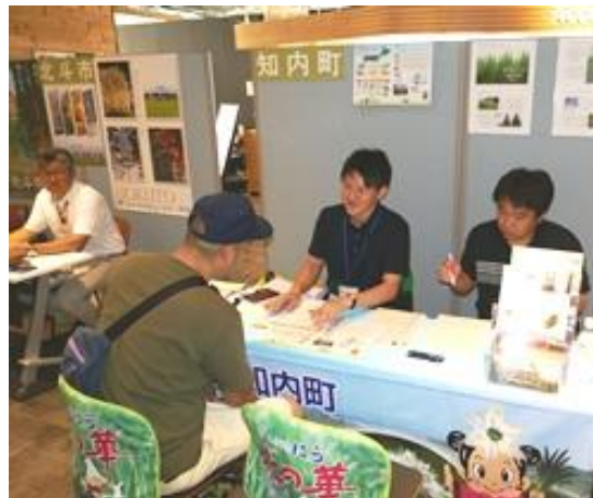
説明を受ける来場者

渡島管内では、農業分野における情報共有と課題解決を目的として、行政機関・普及センター・試験研究機関・農協・ホクレンをメンバーとする「渡島農業振興連