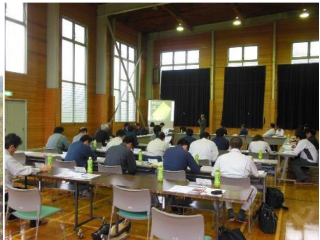
真剣な表情で講義を聞く受講者