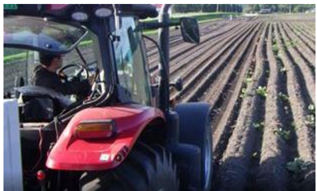
自動操舵不使用区（運転者は進行方向・後方共に確認が必要）