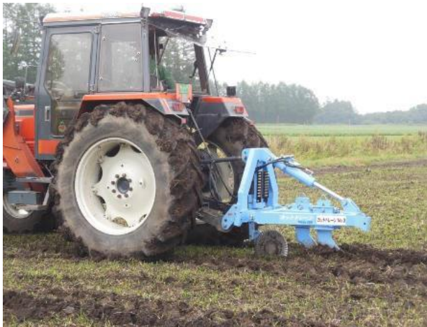
カットドレーンはホクレンのレンタル機を使用

来場者からは、「地域で排水性改善を学べる良い機会となった。石がある地域も多いため、対応しそうな新機材についても注目したい」との声が寄せられました。