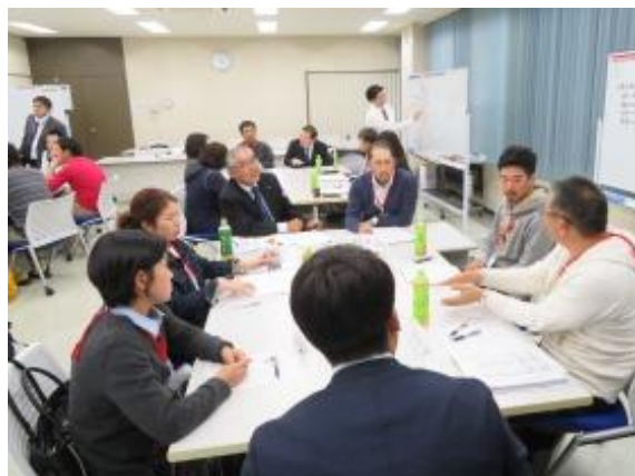
昨年の研修会の様子

ホクレンでは、担い手生産者を対象に「トマト」をテーマとした研修会を下記のとおりで開催します。研修の目的は、①基礎知識の習得、②担い手同士のつながりの強化です。昨年の同研修会には21名の方が参加し、「基本技術の復習・確認や省力化の基本を学べた」などの声がありました。