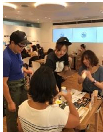
生クリームでバター作り