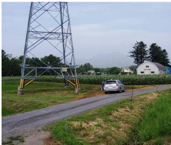
鉄塔脇での RTK 精度調査の様子 （乗用車に RTK 受信機を設置して調査）

その結果、40km 程度離れた地点でも RTK フィックス時間および平均座標からの精度に問題がないことを確認しました。さらに、ホクレン苫小牧支所（苫小牧市若草町）においても長沼基地局（距離 38.3km）からの精度を測定したところ問題はありませんでした。なお、同日、高圧電線の鉄塔や防風林などの障害物が RTK に及ぼす影響についても調査を行いましたが、これらの付近では精度が低下する結果となりました。