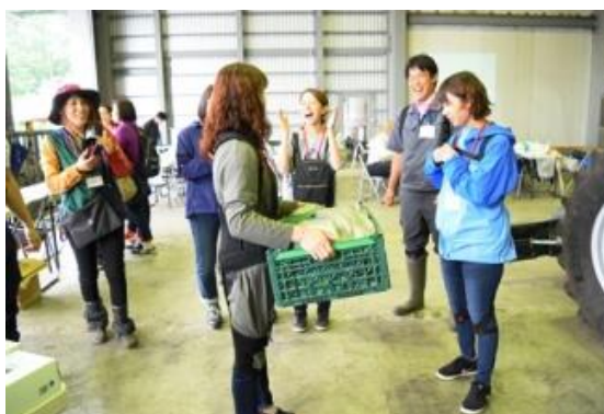
アシストスーツの試着ブースも好評