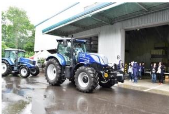
雨天のため、圃場ではなく駐車場で試乗

今回のイベントをきっかけに、トラクター操作ができる女性が増えることで、労働力不足解消の一助になることが期待されています。