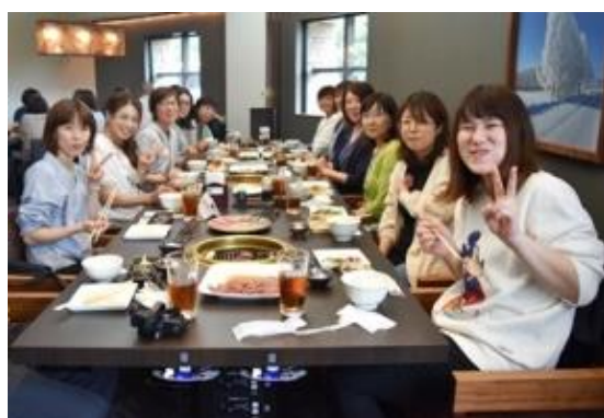
ランチ会で女性同士のつながりを深めた