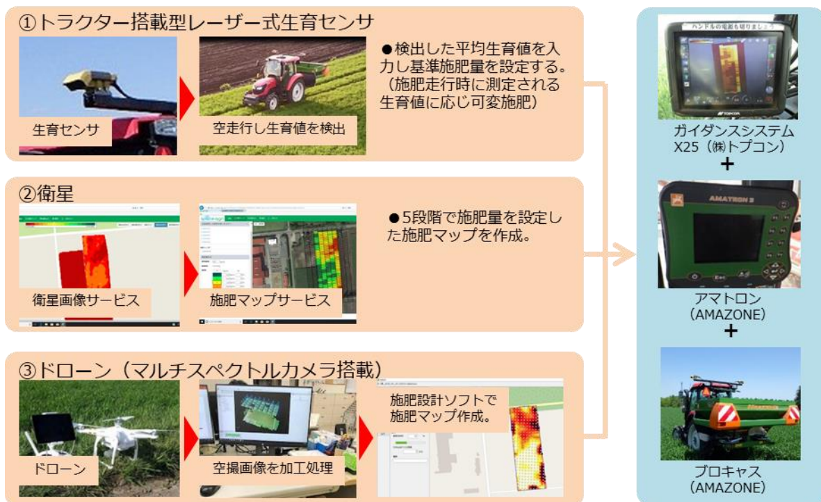
試験に使用したリモートセンシングと可変施肥の機器類 (アグリポート 18 号より抜粋)