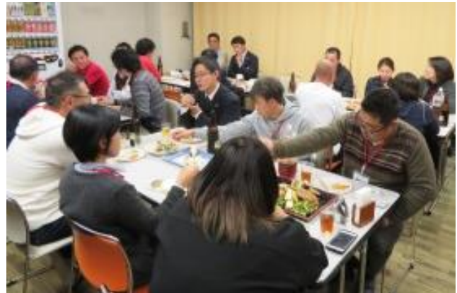
研修センターの食堂で行われた懇親会