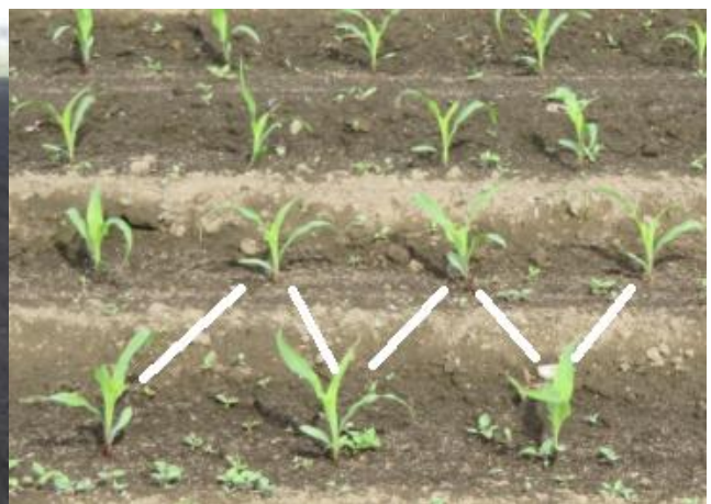
飼料用とうもろこしの千鳥播種