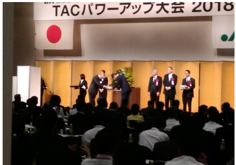
表彰を受ける JA あさひかわ

大会には JA あさひかわのほか道内から 4 JA が大会に参加し、全国の JA 関係者と交流を図り、府県での取組みについて情報収集を行いました。