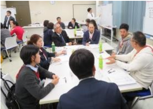
「総合討論」で議論する受講者

今後12月に「小麦・大豆」、2月に「水稻」をテーマとした同様の研修会を実施する予定です。