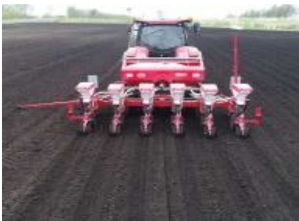
真空播種機による播種作業の様子