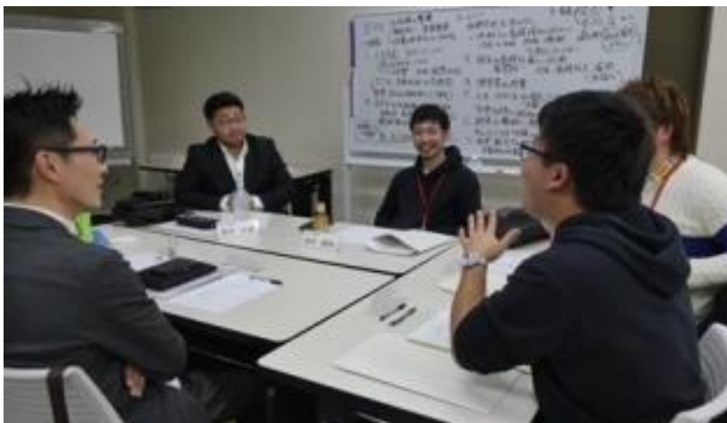
昨年実施した「水稻」をテーマとした研修会の様子