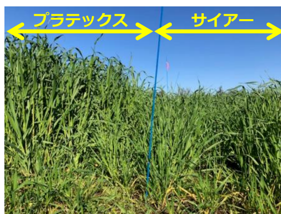
品種の比較 (8/20日播種区・10/19撮影)

年内には緑肥の乾物重量、土壌中の線虫密度の推移を調べます。また、来年は、にんじんの収量や線虫被害程度を調べる予定です。