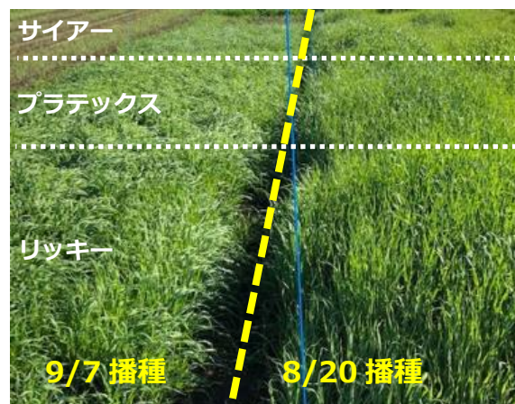
播種時期の比較 (10/19撮影)