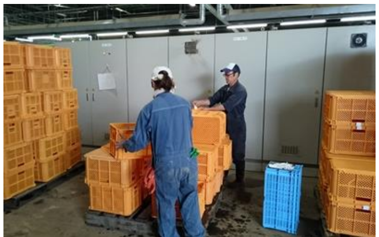
交流期間中に音更町農協の撰果場でも作業をおこなった

音更町農協と宮崎県の西都農協間で労働力相互供与の取組み（地域間連携）を開始しました。この取組みは、春から秋が農繁期となる北海道と、その逆で秋から春が農繁期の九州とでお互いに労働力を補完し合う