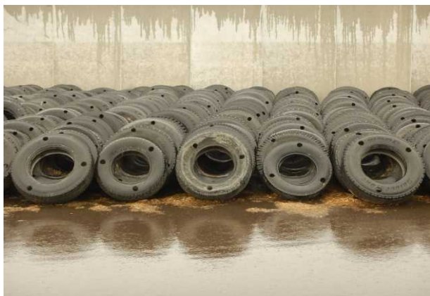
写真1 整理整頓されたサイロ周辺のタイヤ