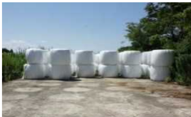
写真2 ロールベールの縦積み保管、越冬前に破損の点検を