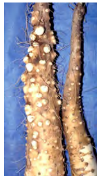
写真3 滞水による首部の突起