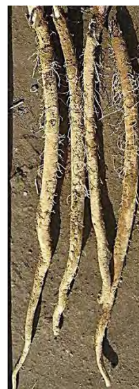
写真6 陥没による形状不良

掘り取り後は根先のしおれによる品傷みを防ぐため、コンテナに内包資材を充て品質を保持する。