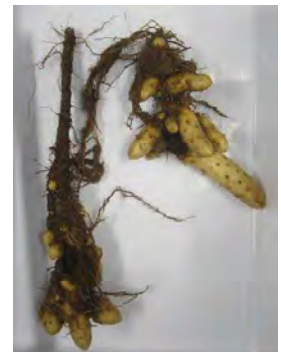
写真5 褐色腐敗病（崩壊型）