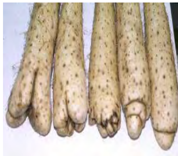
写真2 排水不良による尻部のコブ