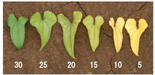
写真1 葉色の比較（数値はSPAD値）