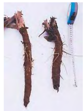
写真7 滞水による根先の腐敗