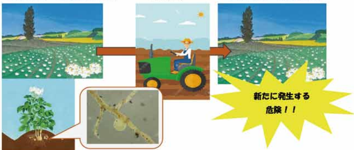
（シストセンチュウ未発生ほ場）

芦別市は未発生地域であるため、芦別市ジャガイモシストセンチュウ対策協議会では、ジャガイモシストセンチュウ侵入対策の取組を実施しております。