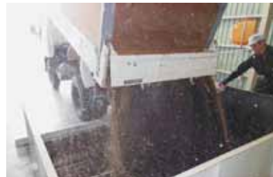
ナタネ受け入れ風景