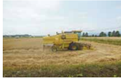
秋小麦収穫作業風景

ナタネは降雨による穂発芽の心配がある為、天候に注意しながら適期刈り取りを目指して作業を進めています。