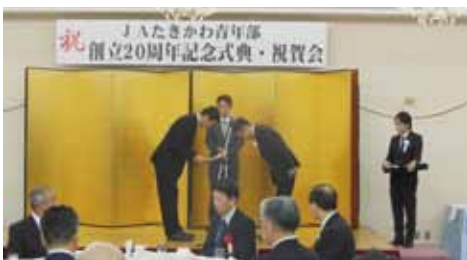
功労者表彰の様子