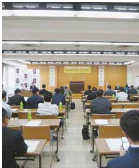
コンテスト会場内の様子

十一月七日（火）岩見沢の空知農業会館にて「第三回空知地区ゆめぴりかコンテスト」が開催されました。コンテストは「産地PR」、「審査員による食味官能試験」によって審査されます。当JAは芦別産のゆめぴりかを出品し、準グランプリとなりました。空知管内は良食味米産地ですので、その中での準グランプリという事で非常に良い結果となりました。