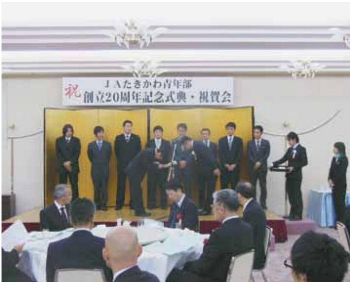
歴代部長表彰の様子

来賓祝辞では、工藤組合長、滝川市市長、赤平市市長、芦別市市長より祝辞を頂きました。