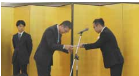
歴代事務局表彰の様子