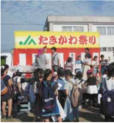
青年部のイベント野菜重量当てゲーム

当日は天候もよく絶好の祭り日和になりました。今年も、滝川東小学校合唱部による演奏、JA青年部によるゲーム大会、ダンスパフォーマンス、バンド等多彩なイベントを開催。青年部、女性部、Aコープ、空知土地改良区、販売部、金融部、共済部が出店をし、組合員や地域の住民など多くのお客様で賑わいました。青年部ではかき氷、焼き鳥、女性部ではフランクフルト、冷やしきゅうり、Aコープでは焼き物、飲み物などの販売、空知土地改良区では人形すくい、金融、共済部では各種キャンペーンなどのPR、販売部では各種農産物の販売を行いました。祭りの最後には大抽選会が行われ大変盛り上がりしました。ご来場して頂いた方には感謝申し上げます。