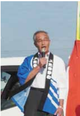
オープニングセレモニーで挨拶する工藤組合長