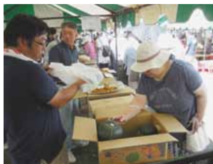
農産物販売の様子 (南瓜)

八月十九日（土）、二十日（日）第四十四回芦別農業祭りがJAたきかわ芦別支店前の北大通りにて開催されました。昨年は大雨により二日目が中止になりましたが、今年は二日間ともに天候に恵まれ、無事に開催されました。イベントでは先着200名様までに芦別産米「ふっくりんこ」が無料配布され、長蛇の列ができ賑やかになっていました。販売部のブースでは、芦別産の南瓜、メロン、花、馬鈴薯など各種農産物が販売さ