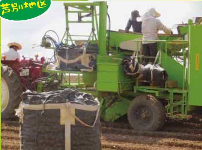
六平 潔さん圃場 種子馬鈴薯収穫作業風景