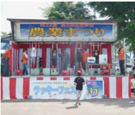
青年部ステージイベント健康ぶら下がり器にぶらさがり一番長くぶら下がっていただけるか？

れ、こちらも長蛇の列ができ飛ぶように売られていきました。また、熊本県湯前町のブースがあり、特産物の葡萄が販売されておりました。二日間ともに最後のイベントとして抽選会があり大盛況となりました。ご来場して頂いた方には感謝申し上げます。