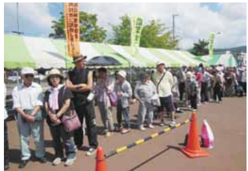
芦別産米「ふっくりんこ」無料配布に並ぶ長蛇の列

れ、こちらも長蛇の列ができ飛ぶように売られていきました。また、熊本県湯前町のブースがあり、特産物の葡萄が販売されておりました。二日間ともに最後のイベントとして抽選会があり大盛況となりました。ご来場して頂いた方には感謝申し上げます。