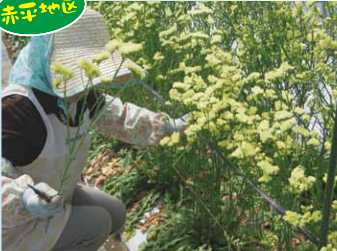
中西 幸一さんハウス 花収穫作業風景