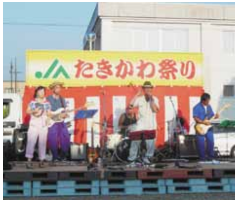
農協スカパーライズオーケストラによるバンド演奏