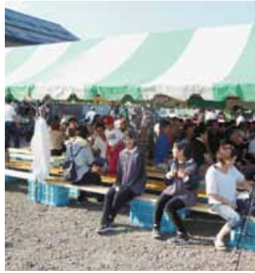
会場で賑わっている様子