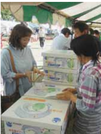
農産物販売の様子 (メロン)