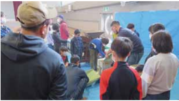
上芦別小 脱穀体験