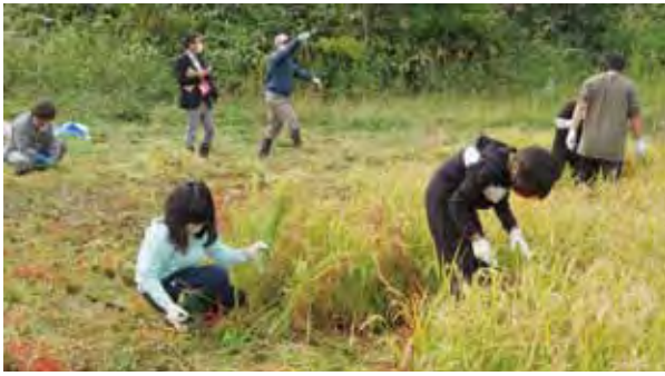
上芦別小 稲刈り体験