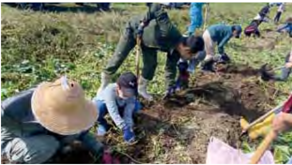
江部乙小 さつまいも収穫