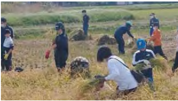
滝川西小・第一小 稲刈り体験