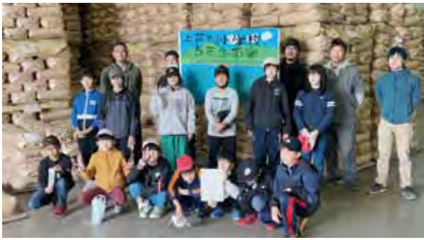
上芦別小 米施設見学