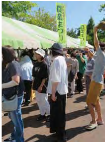
大盛況の農産物販売