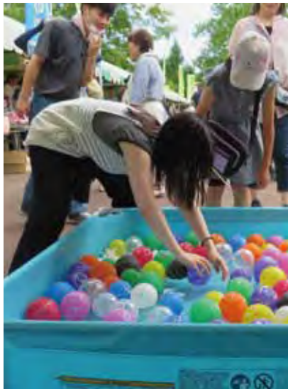
お祭り広場の様子

気温が30℃を超える残暑厳しいなか、多くのお客様に足を運んで頂き第47回芦別農業まつりは盛会に終了しました。