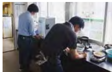
判定作業をするJA職員