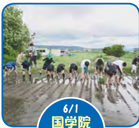
6/1 国学院 江部乙小 田植え