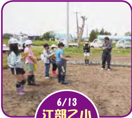
6/13 江部乙小 さつまいも 移植