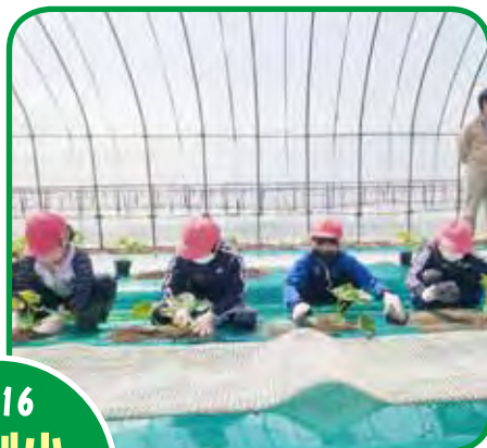
5/16 芦別小 メロン定植 観察