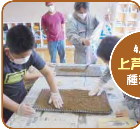
4/25 上芦別小 種まき