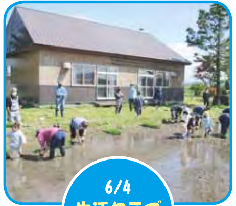
6/4 生活クラブ 田植え