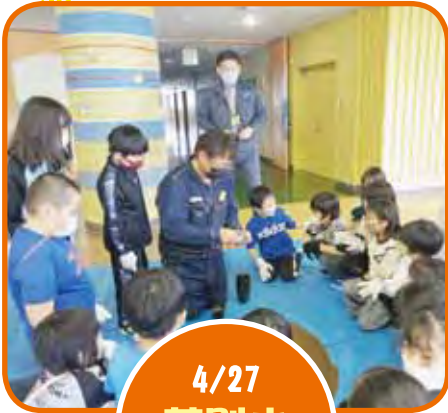
4/27 芦別小 南瓜播種