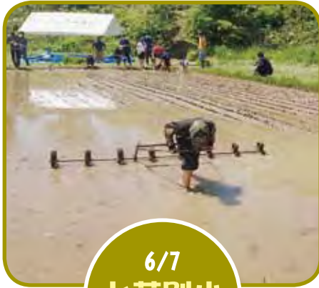
6/7 上芦別小 田植え