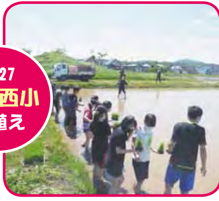
5/27 滝川西小 田植え