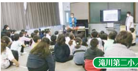
滝川第二小／玉ねぎのお話