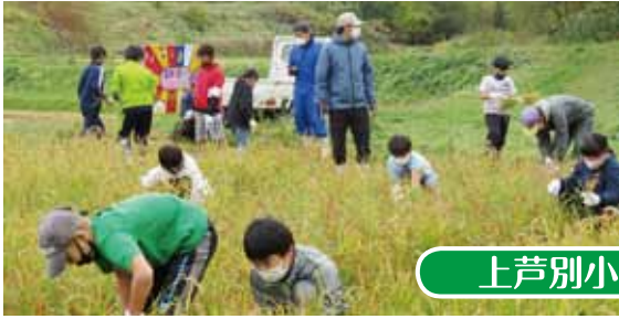
上芦別小／稲刈体験