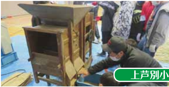
上芦別小／脱穀体験