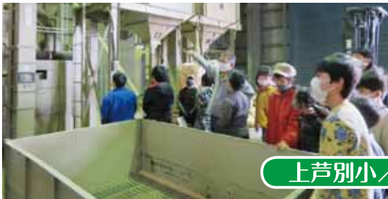
上芦別小／米施設見学