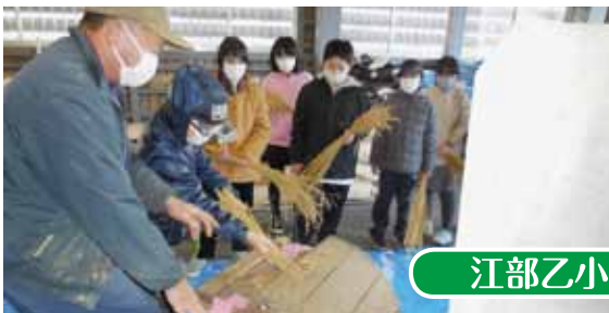
江部乙小／脱穀体験