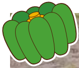
若別小 カボチャは種・定植体験