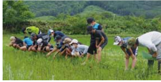
上菅別小 生き物調査