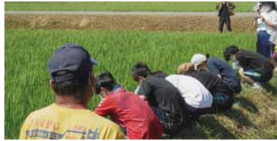
国学院 生き物調査