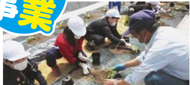
若別小 メロン定植・観察体験