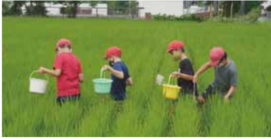
菅別小 生き物調査