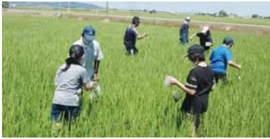
近部小 生き物調査